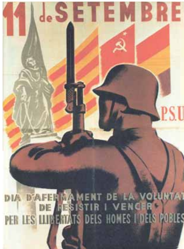
FONT: Partit Socialista Unificat de Catalunya, 1938.