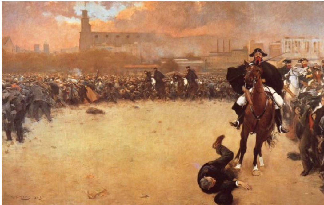
La càrrega o Barcelona 1902

FONT: Ramon Casas, 1899 (Museu de la Garrotxa, Olot).