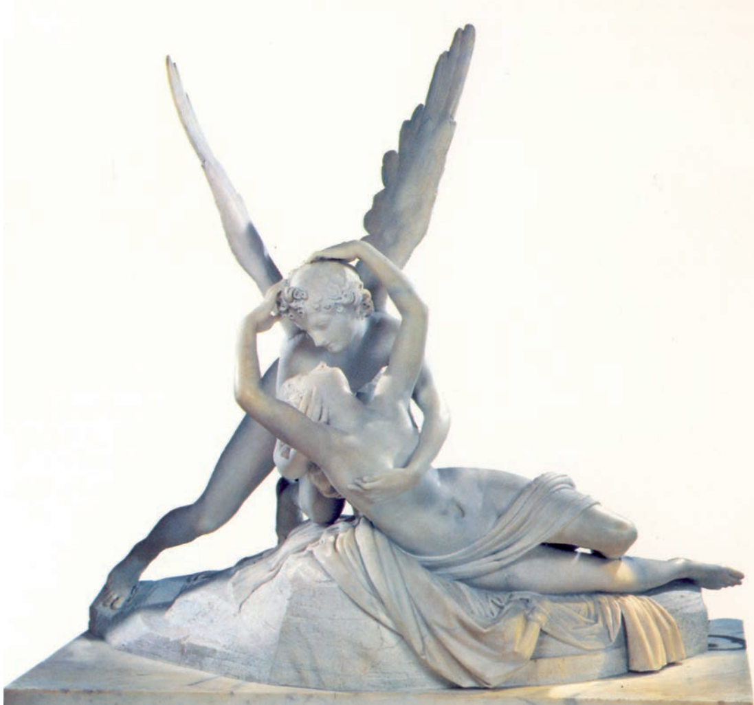
Eros i Psique , d'Antonio Canova