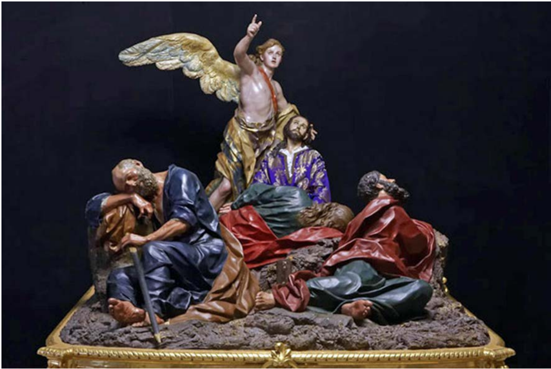
OBRA 3. Oració a l'hort de Getsemani , de Francisco Salzillo.

a) Situeu l'obra en el context cronològic, històric i cultural corresponent.