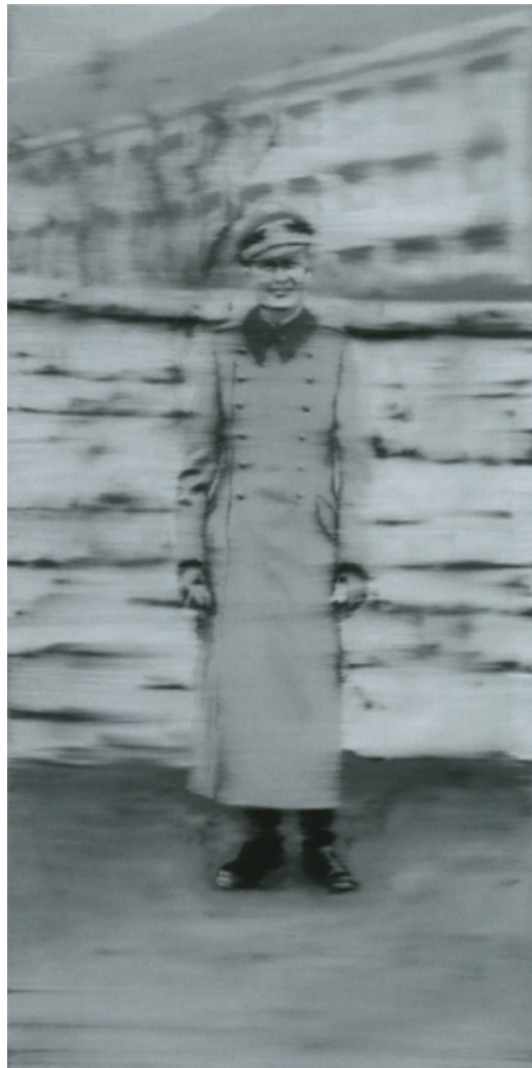
IMATGE B. Gisèle Freund. Maig de 1932 al centre de Frankfurt , 1932. Còpia fotogràfica en blanc i negre, mides variables. Col·lecció particular.